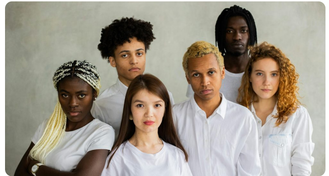
Notre équipe et nos jeunes — saison 2025-2026.

Notre approche ne vise pas à occuper les jeunes, mais à tisser un lien durable qui devient un point d'ancrage dans leur parcours. Ce lien est la condition de tout le reste : prévention du décrochage, développement de l'estime de soi, engagement citoyen.