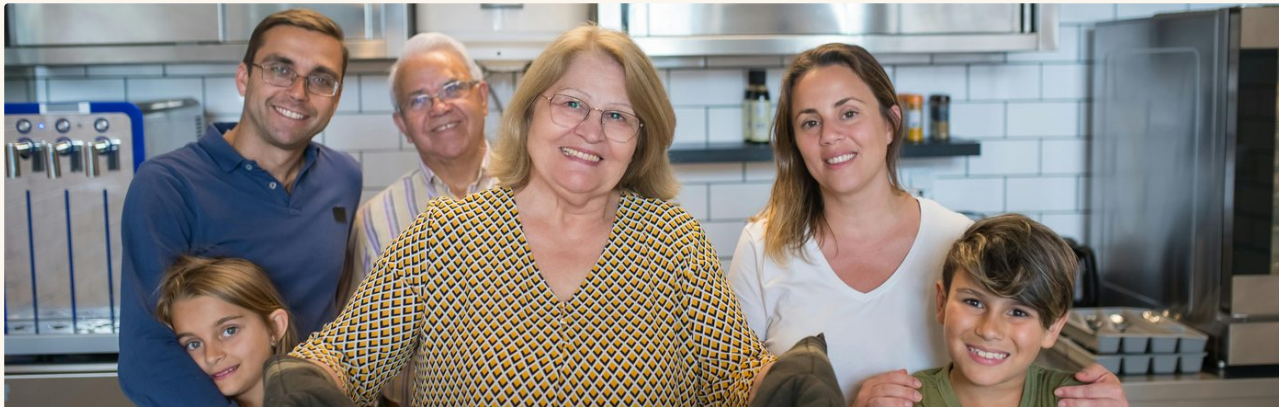
Une cuisine collective intergénérationnelle — saison 2025-2026.

De l'aide alimentaire d'urgence vers l'autonomie durable des familles.